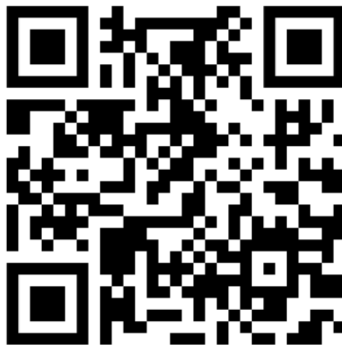
Link zum YouTube DFS-VFR-Tutorial „Richtig Rollen am Flughafen – Rollhaltverstöße vermeiden“.

Ungeachtet der Tatsache, ob ein Rollhalt als Hotspot markiert ist oder nicht, ein Rollhalt darf NIEMALS ohne Freigabe überquert werden! Bei Unsicherheit darüber, ob bereits eine Freigabe erteilt wurde oder nicht, ist unbedingt anzuhalten und bei ATC nachzufragen.