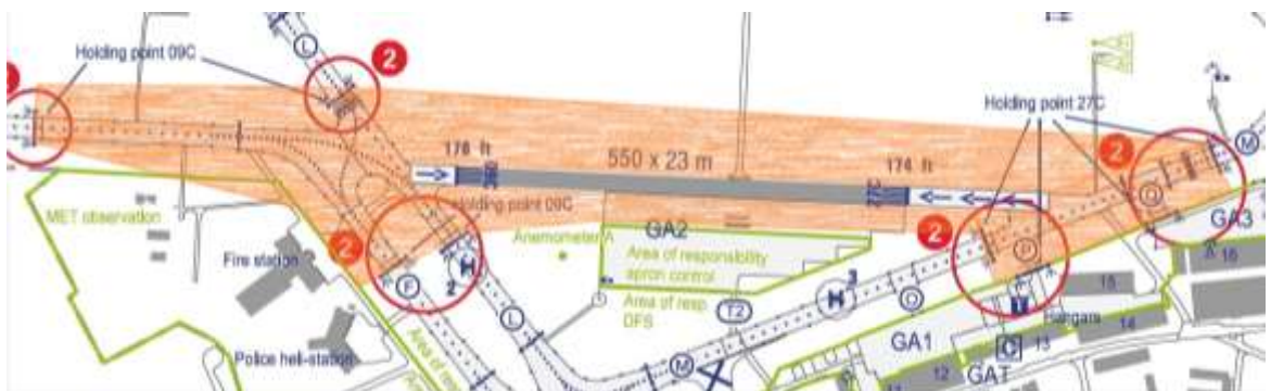
Schematische Darstellung des Sicherheitsbereichs der Piste 27C/09C.

Der Sicherheitsbereich der Piste 27C/09C ragt in die Rollwege Mike, Foxtrott, Lima und Golf hinein. Auf diesen Rollwegen gibt es die bekannten Rollhalt-Markierungen. Die physische Piste ist für den Piloten an dieser Stelle meist nicht erkennbar. Der Sicherheitsbereich einer Piste darf NIEMALS ohne Freigabe be- rollt werden. Ohne erteilte Freigabe ist zwingend an den Rollhaltmarkierungen anzuhalten. Denn das Überrollen einer Rollhaltelinie ohne Freigabe ist ein Ein- dringen in den Sicherheitsbereich einer aktiven Piste.