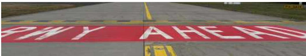
Rollhaltmarkierung mit zusätzlicher Hotspot-Kennzeichnung auf den Rollwegen.

Die in der Vergangenheit durch Rollhaltverstöße auffälligen Rollhalteorte sind bereits in der AIP als Hotspots markiert und auch am Boden mit einem zusätzlichen roten Balken mit der Aufschrift „RWY AHEAD“ versehen.